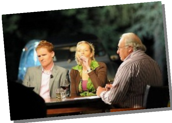
en de uitzending begint...