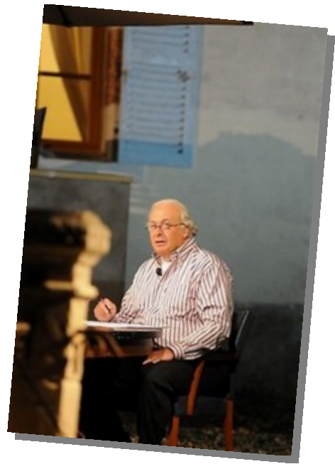
en deze 'rare vogel' in die ouwe Eend wacht op het eindshot om het glas te heffen...