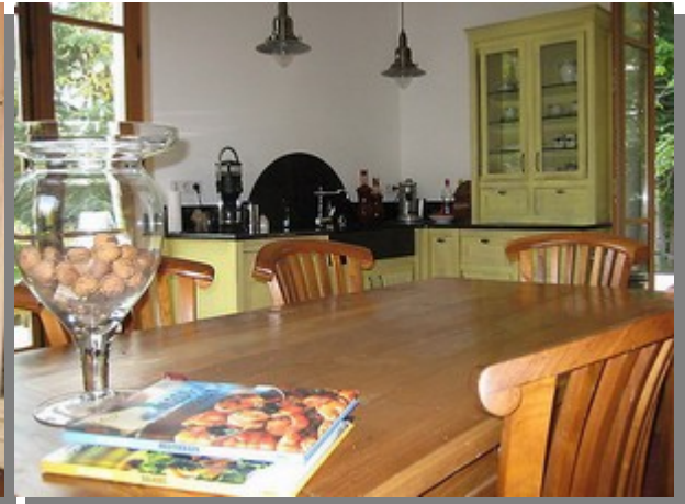
de keuken toen en nu...