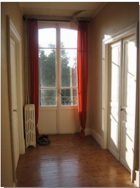
de hal op de 1e verdieping toen en nu...