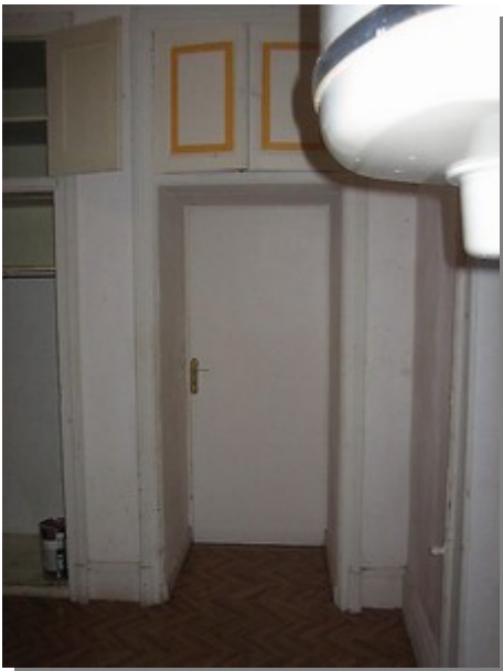
de bijkeuken toen en nu...