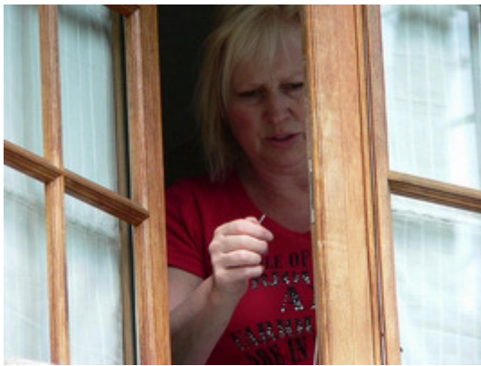
Helmi die haar gordijntjes aan het hangen is...